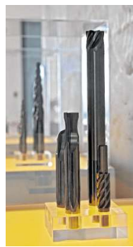
Eine Kernkompetenz der Firma ist die Fertigung von Sonderwerkzeugen.

Mit all diesen Neuerungen hofft die Kopp Schleiftechnik GmbH, ihre Dienstleistungen in Zukunft noch besser an die Wünsche der Kunden anpassen zu können. kbw