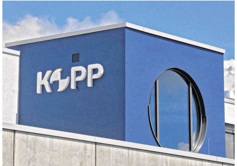
Die Kopp Schleiftechnik hat den Umzug genutzt, um ihren Auftritt zu modernisieren. Dazu gehört auch ein neues Logo.