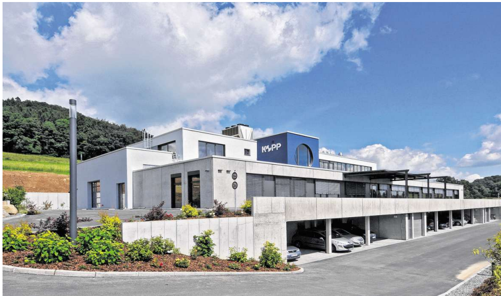
Seit März befindet sich die Kopp Schleiftechnik in einem Neubau am Ortseingang von Winterkasten. Dort haben die Mitarbeiter doppelt so viel Platz, wie im Stammsitz.

Der erste Spatenstich zu dem Projekt erfolgte Ende 2014. „Die alte Werkhalle war einfach zu klein geworden“, begründet Kopp diesen Schritt. Im alten Bau standen den 40 Mitarbeitern 1350 Quadratmeter zur Verfügung – heute haben sie mit 2800 Quadratmetern mehr als doppelt so viel Platz und müssen nicht mehr befürchten, sich gegenseitig auf die Füße zu treten. „Zeitweise war es so, dass manche Mitarbeiter außerhalb arbeiten mussten“, erinnert sich Kopp – und das obwohl die damalige Produktionsstätte mehrfach ausgebaut wurde. Irgendwann war kein Platz mehr für weitere Anbauten. Den Umzug ins neue Gebäude hat