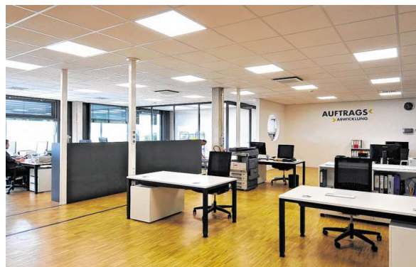
Der Neubau bietet Platz für einen großzügigen Raum zur Auftragsabwicklung.

Räumlichkeiten eingerichtet. „Nach wenigen Tagen haben wir die Produktion wieder aufnehmen können“, blickt er zurück. kw