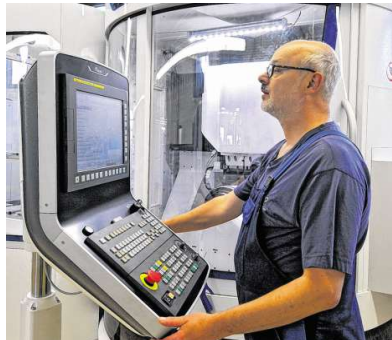
Insgesamt wurden drei neue Maschinen angeschafft.