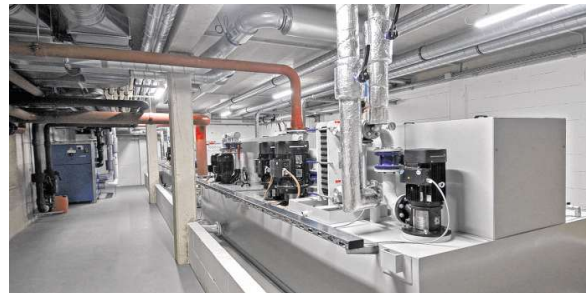
Eine zentrale Ölversorgung sorgt dafür, dass alle 16 Maschinen rund laufen.

sich vor Ort von der Qualität der Werkzeuge zu überzeugen – denn neben der Steigerung der Effektivität ging es Achim Kopp auch darum, Räumlichkeiten zu schaffen, die die Stärken des Unternehmens widerspiegeln.